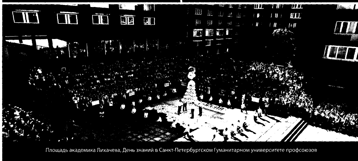
Площадь академика Лихачева, День знаний в Санкт-Петербургском Гуманитарном университете профсоюзов