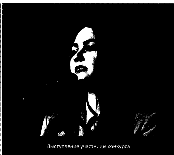
Выступление участницы конкурса