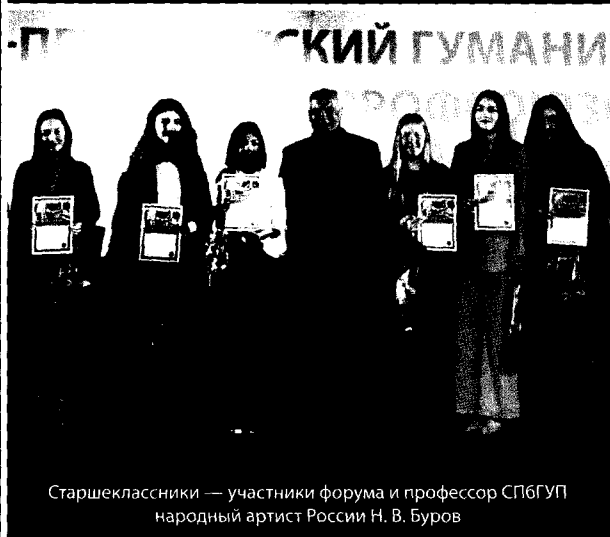
Старшекласники — участники форума и профессор СПбГУП народный артист России Н. В. Буров