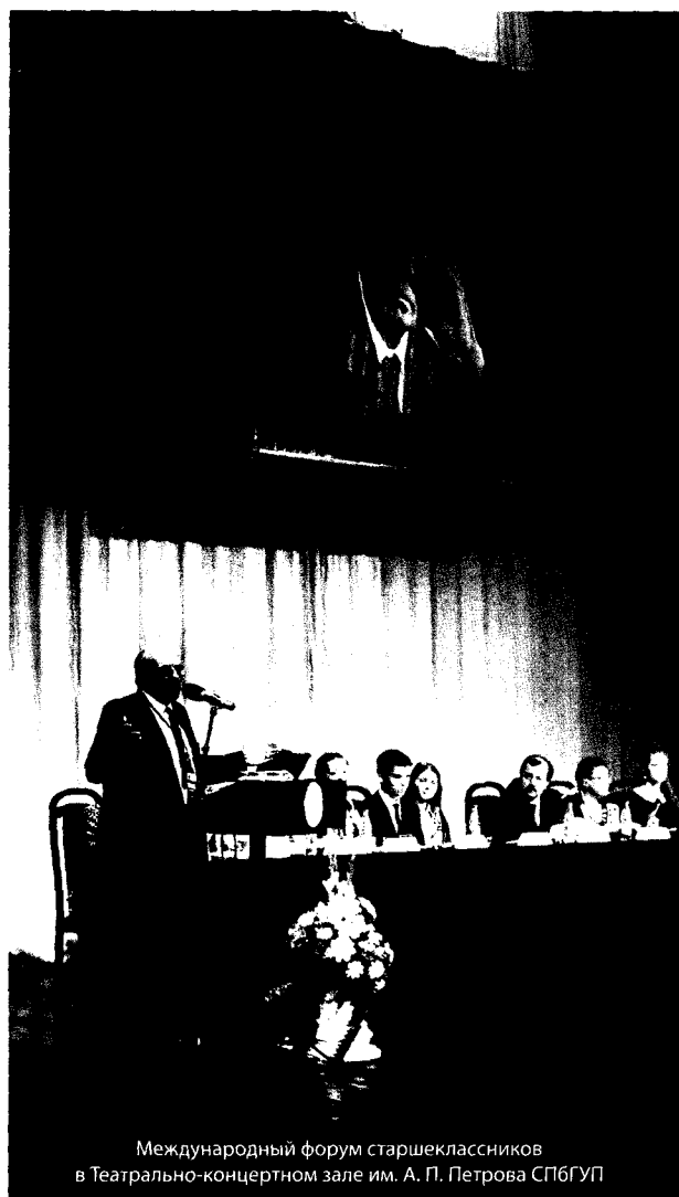
Международный форум старшекласников в Театрально-концертном зале им. А. П. Петрова СПбГУП